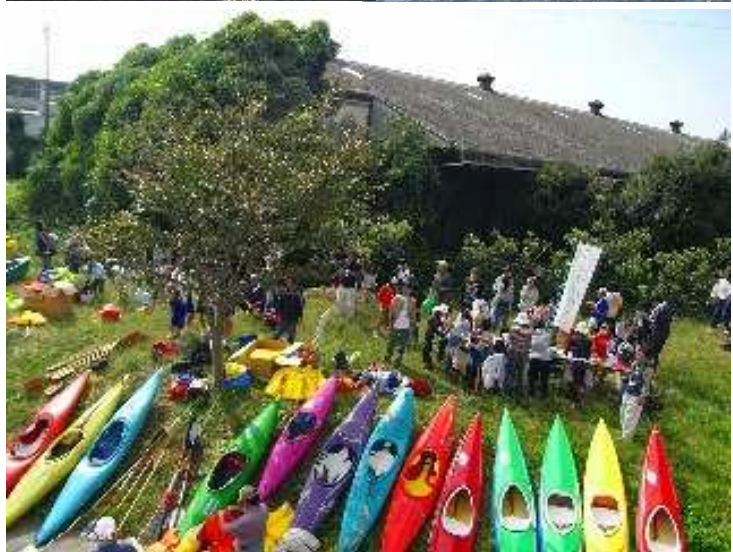
ニコニコ顔の参加者のみなさん！