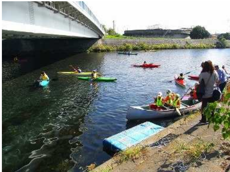
芙蓉橋周辺に、色鮮やかなカヌーがいっぱい！