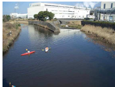
浮島工業団地付近の沼川 桜並木